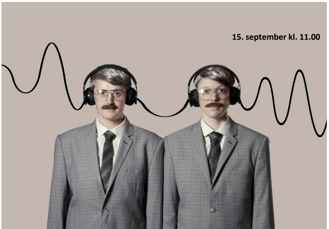
Limfjordsteatrets Akademi for Scenekunst: Kort over øer og andre utopiske steder. (Billede fra Talenternes første forestilling, august 2019)