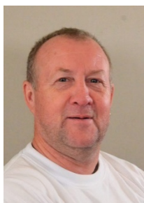
Ib Lank Pedelmedhjælper