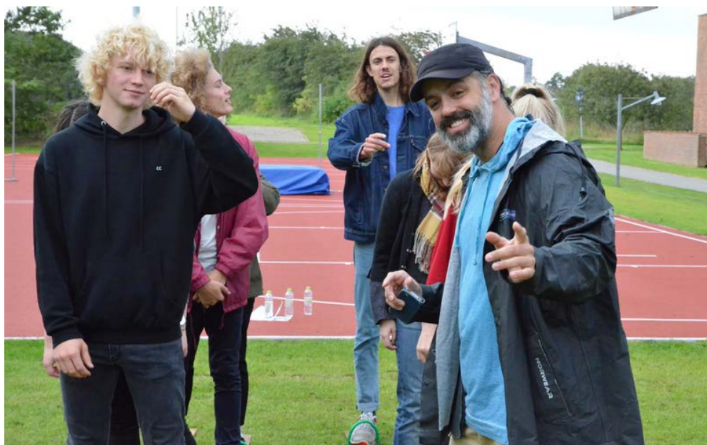
1.g'ernes introduktionsdag 18. august 2017